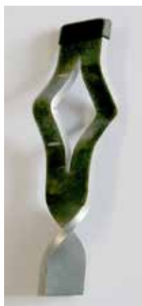
JuSys® ACL -Anker neu

Bisherige Verankerung im eingebauten Bereich nur mit maximaler Standzeit von 9 Monaten