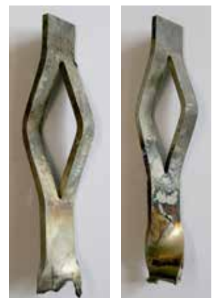
JuSys® ACL -Anker nach ca. 24.000 Betriebsstunden