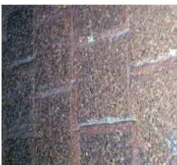
JuSys® CFB nach > 16.000 Betriebsstunden