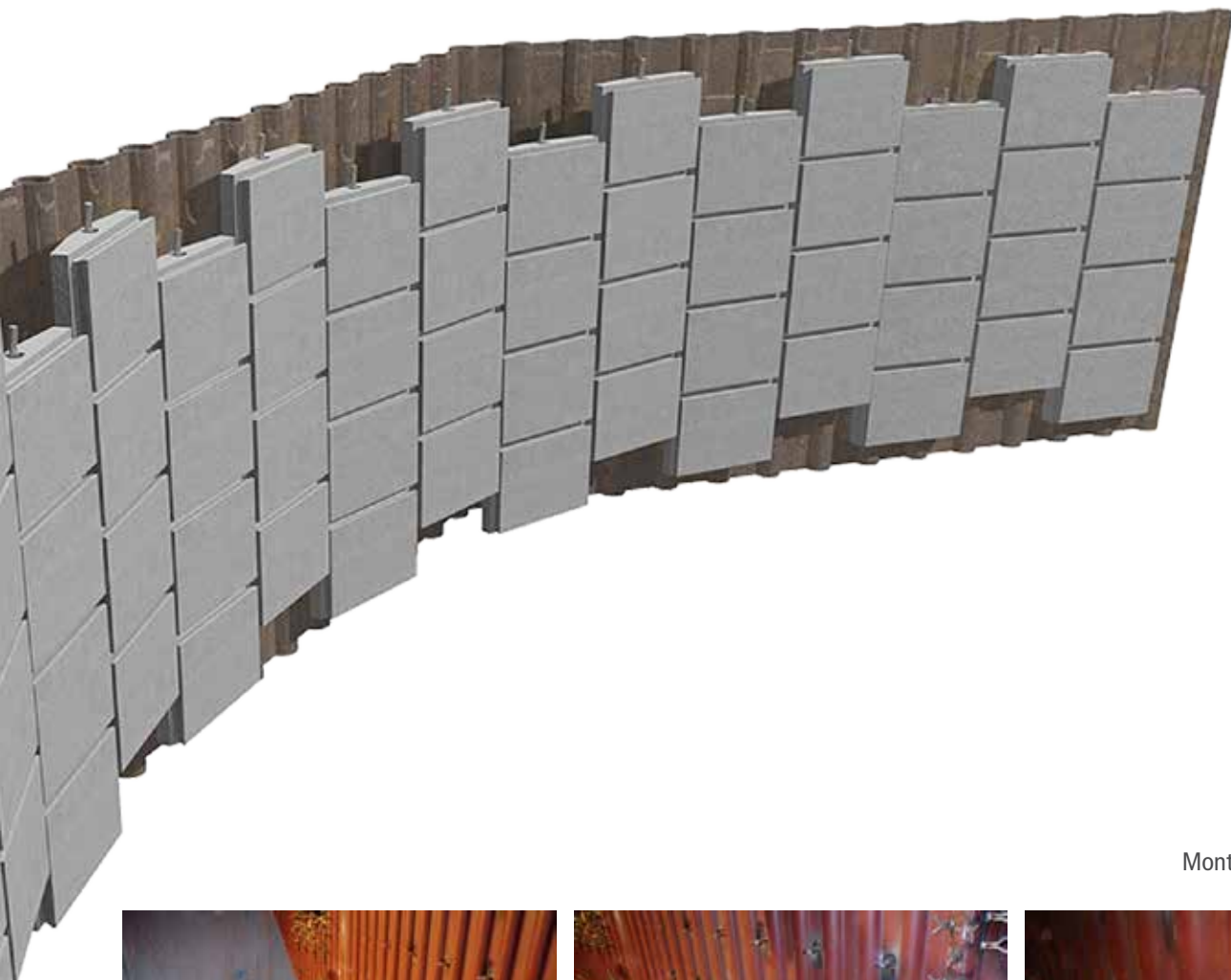
JuSyS® CFB Montage des Plattensystems